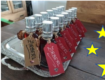
„Zirberl“ - Zirbenschnaps