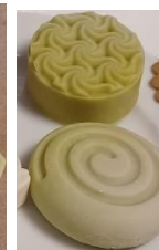
Ylang Ylang Seife