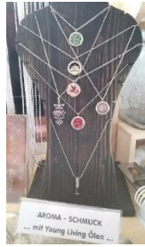
Aroma -Schmuck - Edelstahl - Anhänger - Armspange