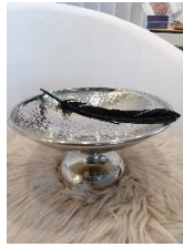
Räucherschale / Räucherfeder