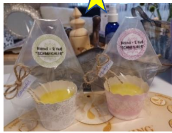
Hand & Fuß – Schmeichler