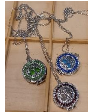
Aromaschmuck - filigran