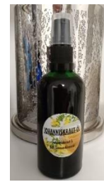
Johanniskrautöl / + Roll on