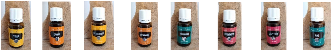
Zitronen 18,00 Orange 17,00 Citrus Fresh 24,00 Zeder 18,00 Pfefferminz 33,00 Zitronengras 18,00 Grapefruit 26,00 Pinie 23,00