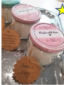
Zirben - Badesalz