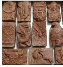
Krafttier - Seifen