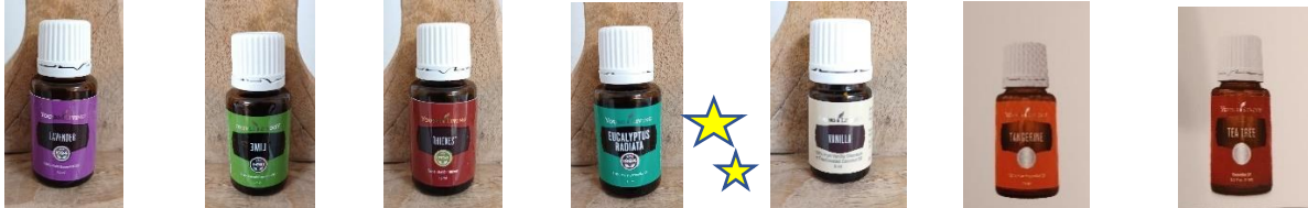
Lavendel 36,00 Limette 19,00 Thieves 53,00 Eukalyptus 28,00 Vanille 48,00 Mandarine 25,00 Teebaum 40,00