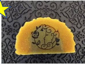
Orangenseife mit Aktivkohle