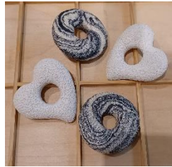
Herz und Donut Lavastein