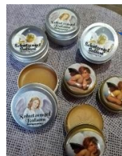
Schutzengel - Balsam