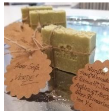
Haarseifen Brennessel – Rosmarin