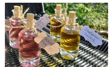
Zirben - & Schafgarbentinktur