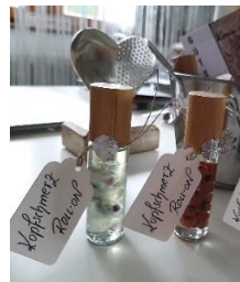
Kopfschmerz Roll on