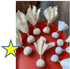
Kräuterstempel mit Inhalt