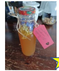
Holunder - Essig